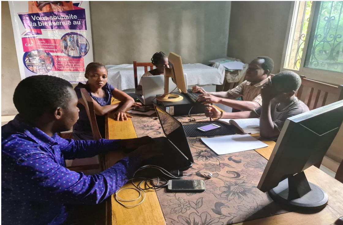
“L’Encadrement des Personnes Défavorisées Autrement”